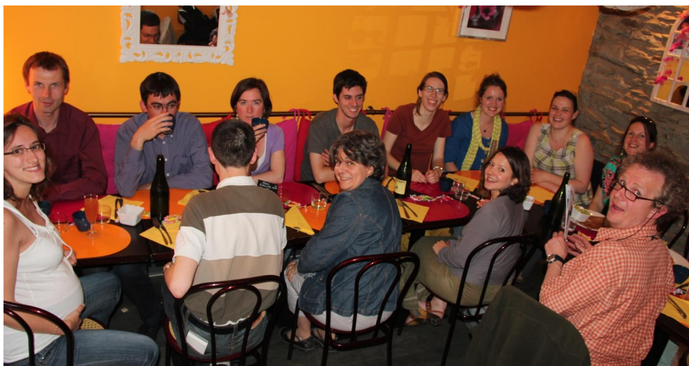
L'Equipe Diocésaine lors du diner de fin d'année à la crêperie La Maison de Joséphine !